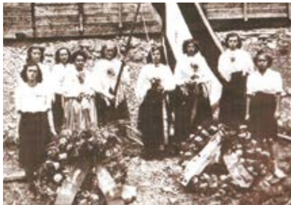
Po osvoboditvi na kraju ustrelitve na odprtem strelišču.