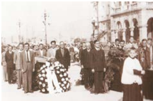
Pogreb petih žrtev, prenos zemeljskih ostankov.