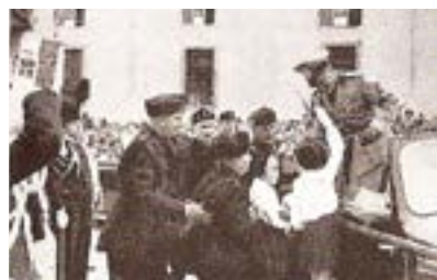
Mussolini v Kobaridu