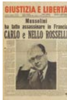
Tednik Giustizia e Libertà

Ob tem bi rad omenil naslednje: takoj po prehodu v novo tisočletje in vstopu v 21. stoletje nam je tržaški kulturni in družbeni delavec Ravel Kodrič priskrbel fotokopijo knjige Il fascismo ed il martirio delle minoranze . Original hrani Istituto storico della Resistenza in Toscana s sedežem v