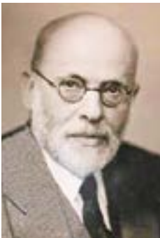
Italijanski protifašist Gaetano Salvemini