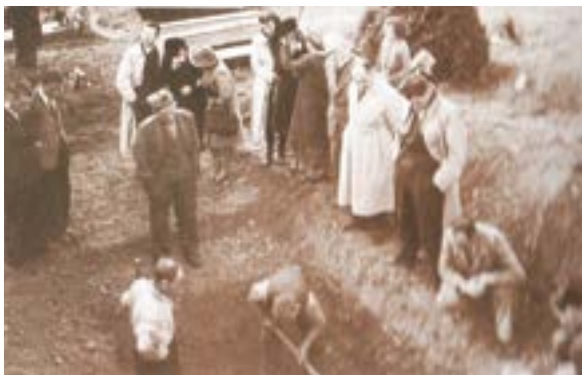
Odkopavanje skupnega groba.

Vid Vremec, ki je deloval v mladinskem komunističnem gibanju skupaj s Pinkom Tomažičem, je bil na drugem tržaškem procesu obsojen na 15 let zapora.